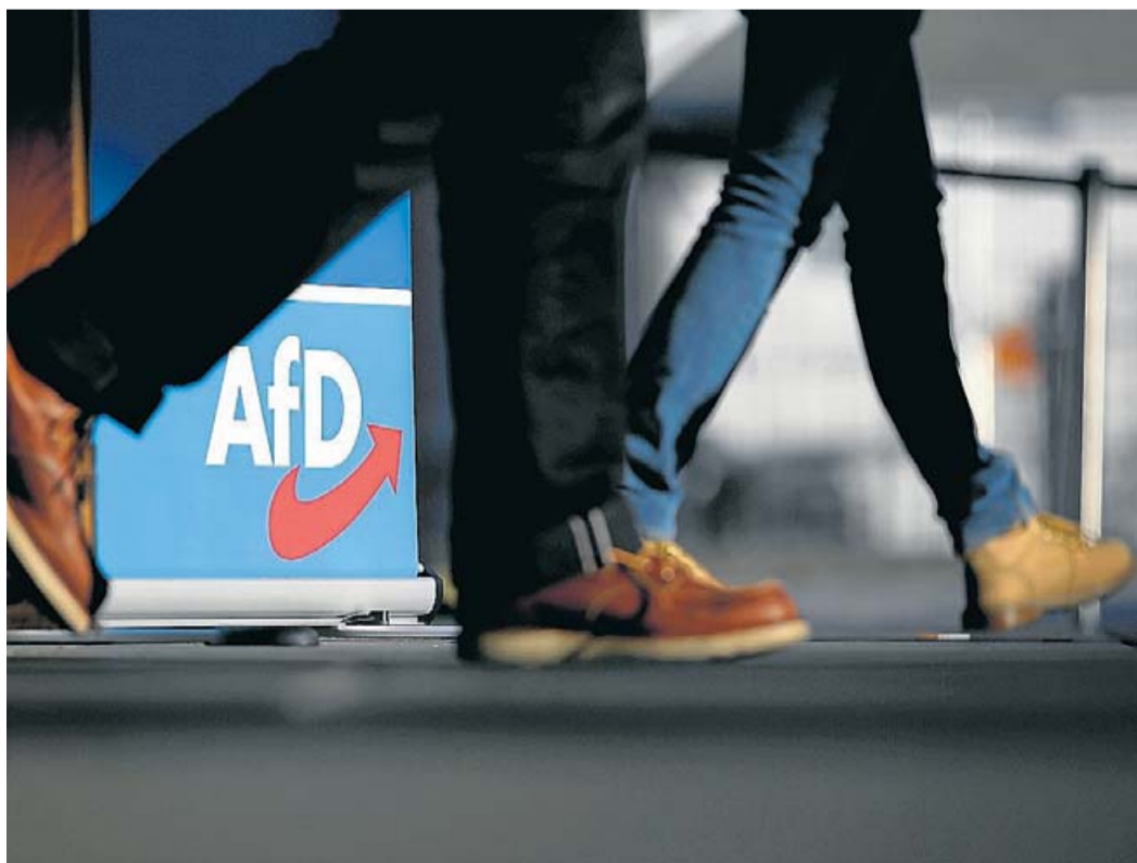
Delegats d'Alternativa per a Alemanya dirigint-se cap al congrés que la formació xenòfoba va convocar a Magdeburg al mes de novembre.

Aquesta dada, sumada al fet que les poblacions que han acollit més refugiats d'origen àrab des del 2015 tendeixen a votar menys a favor d'AfD, permet concloure que el contacte i la barreja de la població local amb persones d'origen diferent disminueixen el vot ultra a Alemanya, siguin quines siguin les seves causes principals.